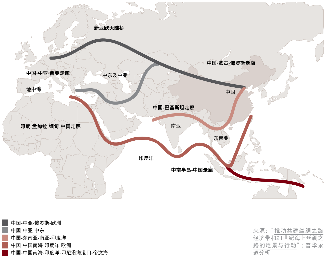
图1 一带一路项目陆海路线

发达经济体的增长速度则要慢得多，例如，在1996年至2014年间，英国道路上车辆的里程数增长相对较小。但是发达国家的交通运输系统依然需要进行大量持续的维修和升级，某些情况下，特别是随着各国政府试图将交通重心转至铁路以减少对环境的影响时，交通运输系统还需要扩建。